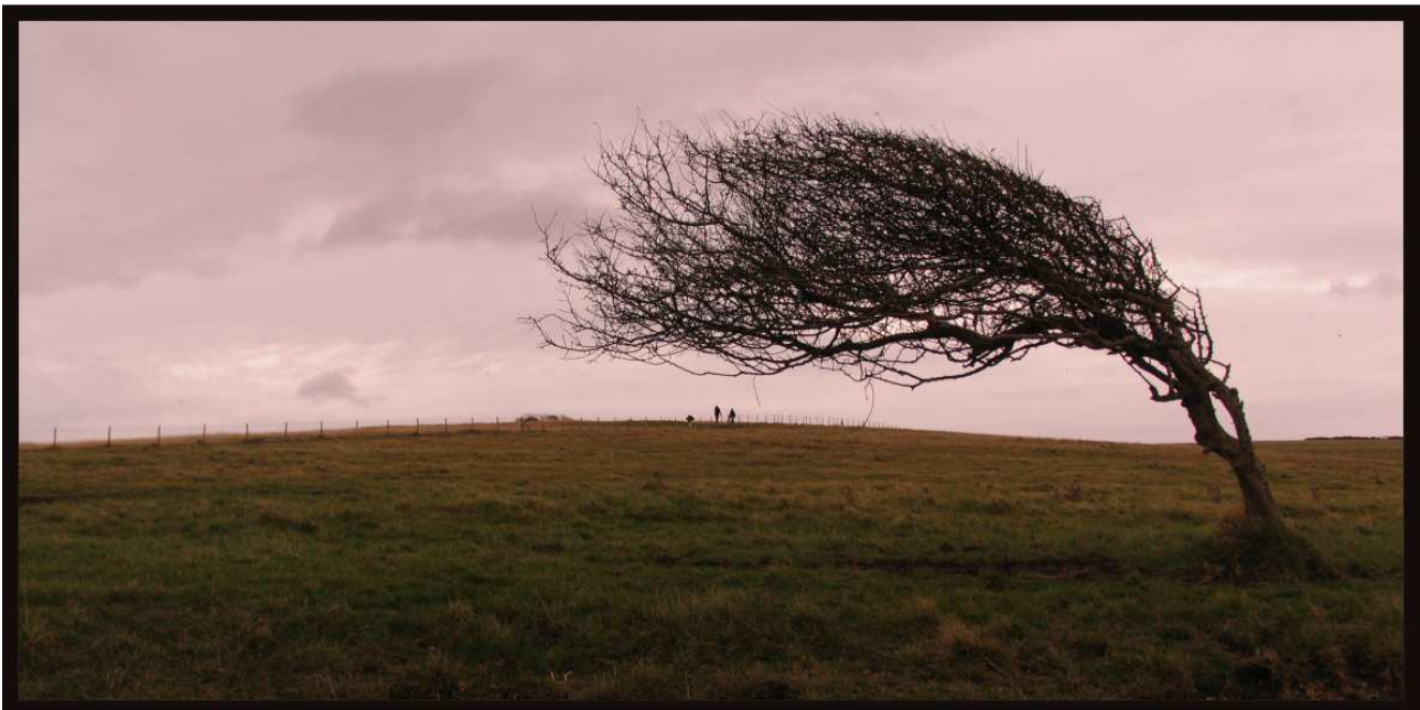
A tree permanently deformed by the strong winds (Seven Sisters, England) Albero permanentemente deformato dai forti venti (Seven Sisters, Inghilterra)

Here the key factor in giving shape to the institutions are the needs to be met. Whichever works best among the existing bodies of government, it will take up the issue; if none can do it, a new one will be appointed. Such systems have no constitutional code, no predetermined bodies, no rigid rules. They are based instead on the persistent agreement of all or most members of each group; they assign a different status to individuals according to group belonging; and they do not formally entrust the different powers of government to separate entities.