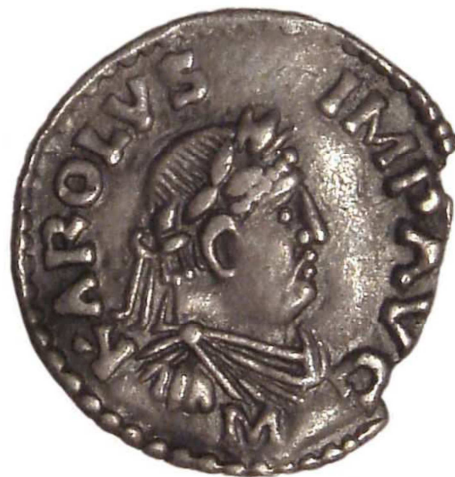
Obverse of a Charlemagne denier / Verso di un denaro di Carlo Magno (Frankfurt, 812-814, Cabinet des Médailles, Paris)

Pope Leo III felt that he may be a fitting candidate to fill the void of secular power in western Europe, and at Christmas mass in 800 he crowned Charles in Rome as Roman emperor. The event, known as renovatio imperii ("renewal of the Empire" in the west) was a political move. The pope aimed at Charles' protection at a time when his own secular reign was threatened by rebellions, and Christianity by heresies; Charles in turn wished for official legitimacy, in order to consolidate his rule on vast and diverse territories. Moreover, both planned to reduce Byzantine influence on the Adriatic sea.