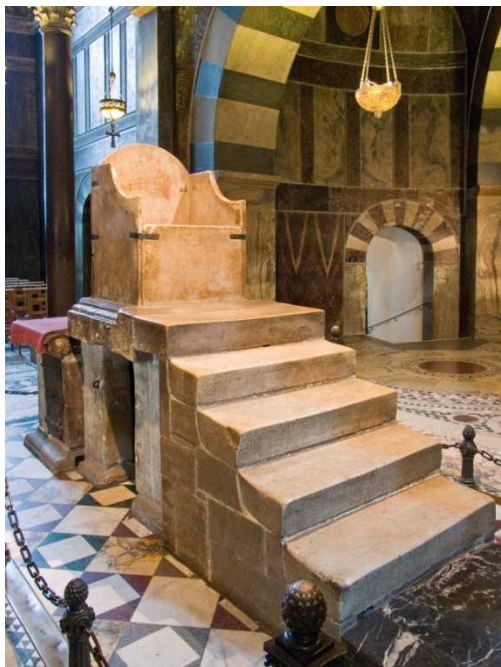
The throne of Charles the Great in Aachen cathedral Il trono di Carlo Magno nella cattedrale di Aquisgrana

HEINRICH FICHTEAU, Das karolingische Imperium. Soziale und geistige Problematik eines Grossreiches , Zürich: Fretz & Wasmuth, 1949; traduzione italiana di Mario Themelly: L'età di Carlo Magno , Milano: Rizzoli, 2004